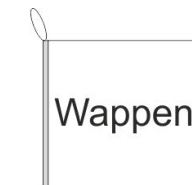
Bootsfahne Inkl. Besatzband, eingelassenem Seil (Strick & Strickschleufe)