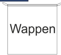
Hängefahne Inkl. Besatzband, eingelassenem Seil und Metall-Karabinern