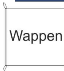
Hissfahne Inkl. Besatzband, eingelassenem Seil und Metall-Karabinern

Preis: 49,50 CHF inkl. MwSt. (- 45,80 CHF exkl. MwSt.) 0