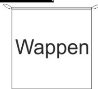
Hängefahne Inkl. Besatzband, eingelassenem Seil und Metall-Karabinern