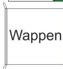
Hissfahne Inkl. Besatzband, eingelassenem Seil und Metall-Karabinern

Preis: 49,50 CHF inkl. MwSt. (45,80 CHF exkl. MwSt.) 0