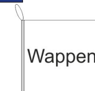
Bootsfahne Inkl. Besatzband, eingelassenem Seil (Strick & Strickschleufe)