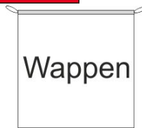
Hängefahne Inkl. Besatzband, eingelassenem Seil und Metall-Karabinern