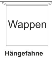
Hängefahne Inkl. Besatzband, eingelassenem Seil und Metall-Karabinern