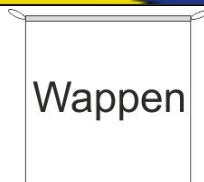
Hängefahne Inkl. Besatzband, eingelassenem Seil und Metall-Karabinern