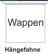
Hängefahne Inkl. Besatzband, eingelassenem Seil und Metall-Karabinern