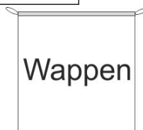
Hängefahne Inkl. Besatzband, eingelassenem Seil und Metall-Karabinern