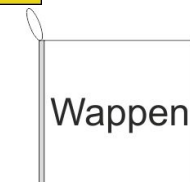
Bootsfahne Inkl. Besatzband, eingelassenem Seil (Strick & Strickschleufe)