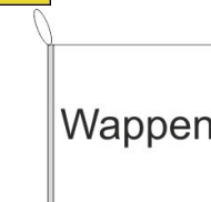
Bootsfahne Inkl. Besatzband, eingelassenem Seil (Strick & Strickschleufe)