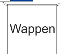
Hängefahne Inkl. Besatzband, eingelassenem Seil und Metall-Karabinern