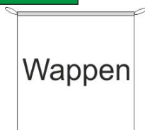
Hängefahne Inkl. Besatzband, eingelassenem Seil und Metall-Karabinern