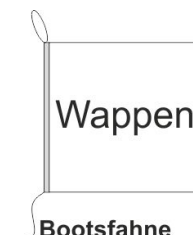
Bootsfahne Inkl. Besatzband, eingelassenem Seil (Strick & Strickschleufe)