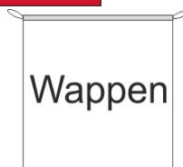
Hängefahne Inkl. Besatzband, eingelassenem Seil und Metall-Karabinern