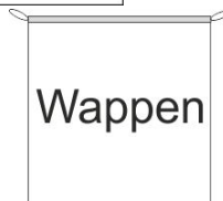
Hängefahne Inkl. Besatzband, eingelassenem Seil und Metall-Karabinern