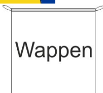
Hängefahne Inkl. Besatzband, eingelassenem Seil und Metall-Karabinern