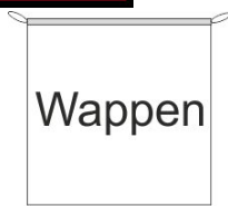
Hängefahne Inkl. Besatzband, eingelassenem Seil und Metall-Karabinern