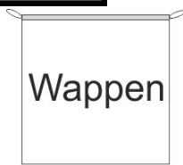
Hängefahne Inkl. Besatzband, eingelassenem Seil und Metall-Karabinern