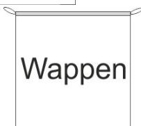
Hängefahne Inkl. Besatzband, eingelassenem Seil und Metall-Karabinern