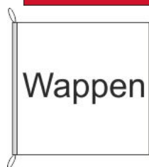
Hissfahne Inkl. Besatzband, eingelassenem Seil und Metall-Karabinern

Preis: 49,50 CHF inkl. MwSt. (- 45,80 CHF exkl. MwSt.) 0